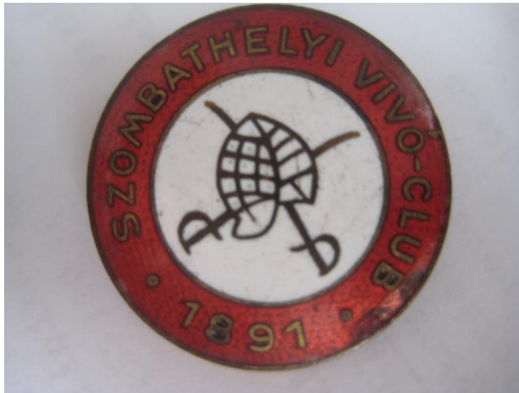
2. Az SZVC címere jelvény formában