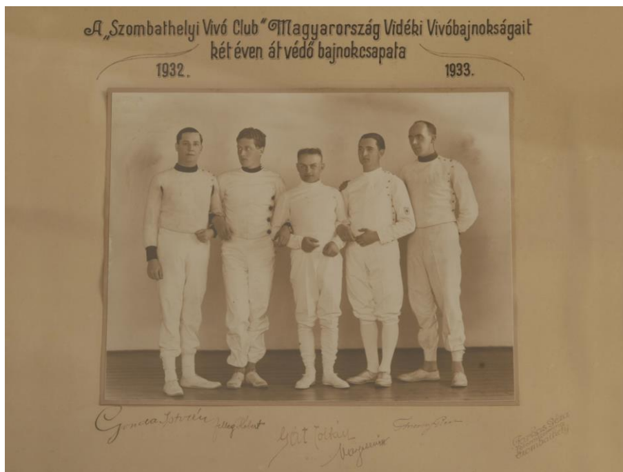
6. A 30-as évek szombathelyi kardcsapata